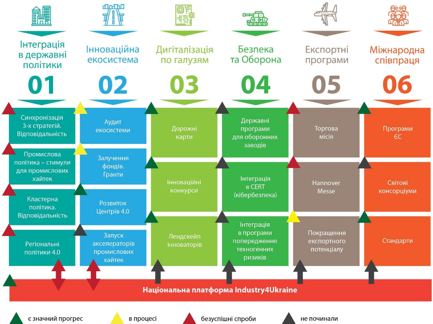
Рис. 1 Портфель проектв Індустрії 4.0